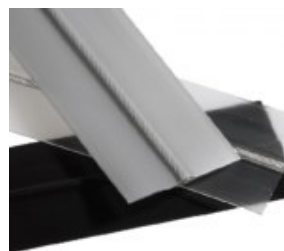
Wgrzewanie taśmy antywłamaniowej